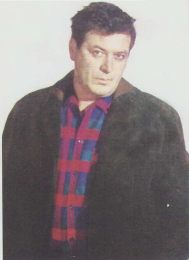
Pregătit de filmare, în haine de lucru