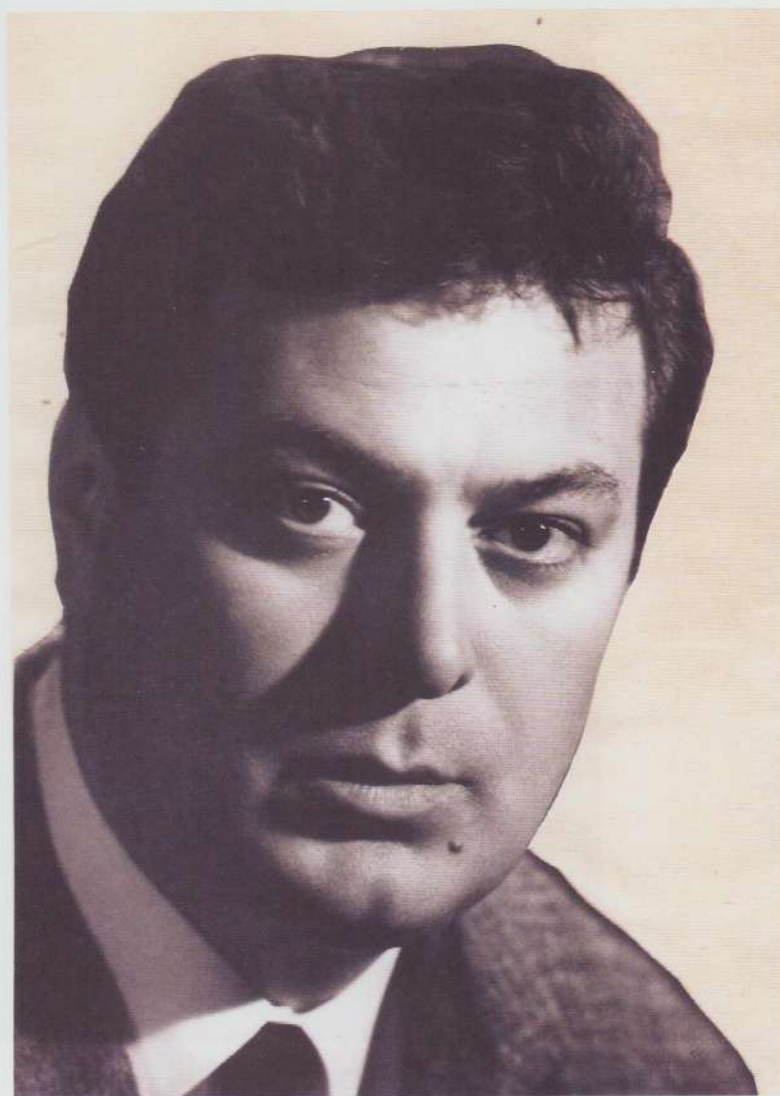
Ion Popescu Gopo în anii '60