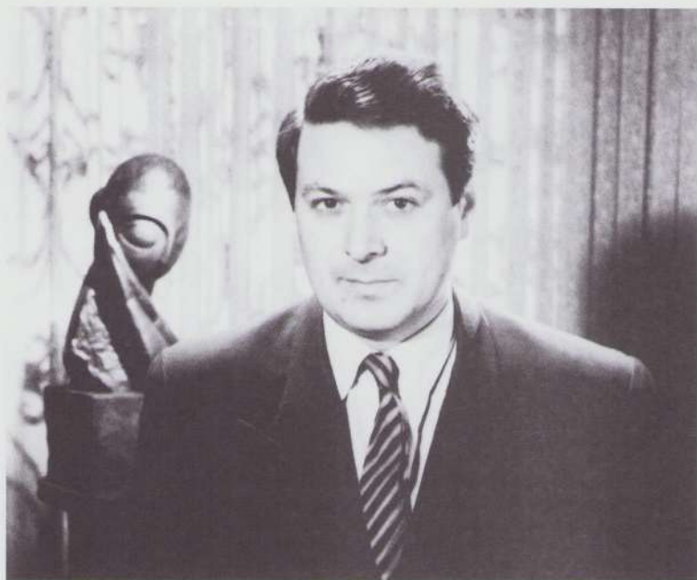
Ion Popescu Gopo alături de Domnișoara Pogany , capodopera lui Constantin Brâncuși