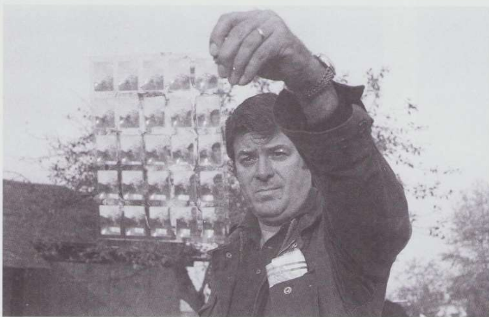
Prim-plan la filmare: Ion Popescu Gopo