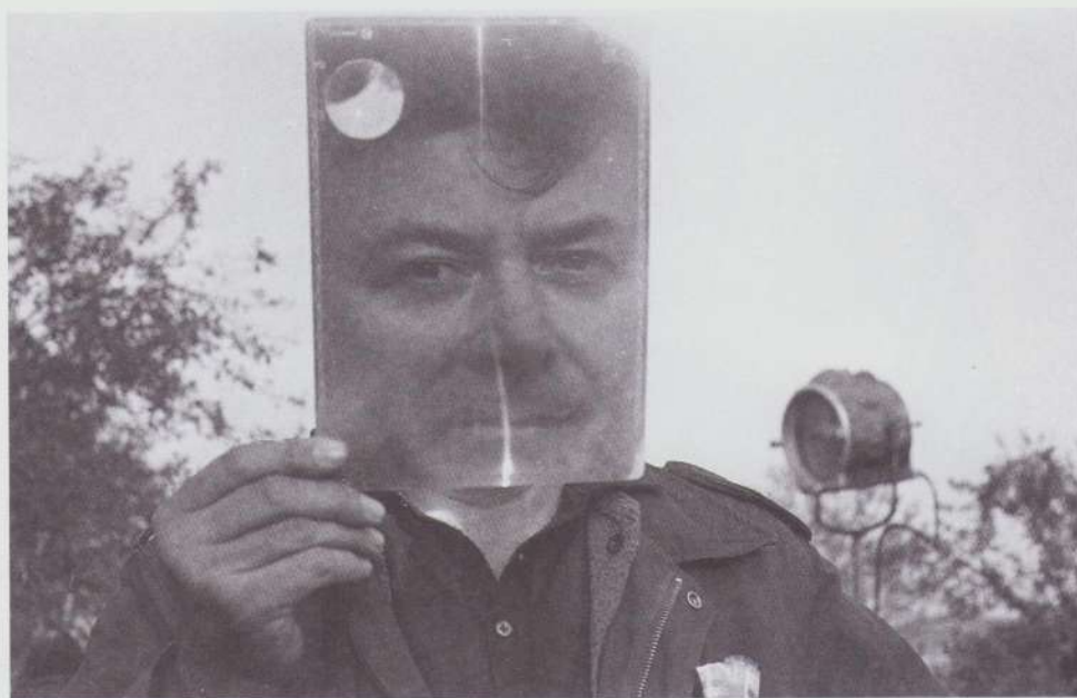
Prim-plan la filmare, Ion Popescu Gopo